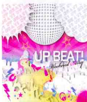
▲UP BEAT-Weekend Story 2009年2月3日発売

ダイエツトを始めたとき、①有酸素運動 （1時間〜1時間半のウォーキング）②半身 浴③リンパマッサージを組み合わせた。自分 の体をよく見つけ、この部分をこうしたい。 と思いつながらマッサージをした。汗をかいて、 水分や質のよい油（アーモンドやオリーブオ イル）を摂ることも大切。座る・歩くなどの 動作を、よい姿勢で行うと、よい筋肉がつく。 ◎これからのどんな生き方をしていきたいか。 自分はあなたがかい家庭で育ち、本当に幸せ だった。幸せな家庭を築いて、いい母親にな りたい。 大会出場をきっかけに知り合った方に誘わ れ、ボーカリストとしてCDの録音も済ませた そうです。